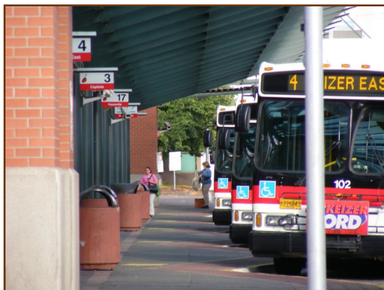
Reemplazo y actualización de autobuses